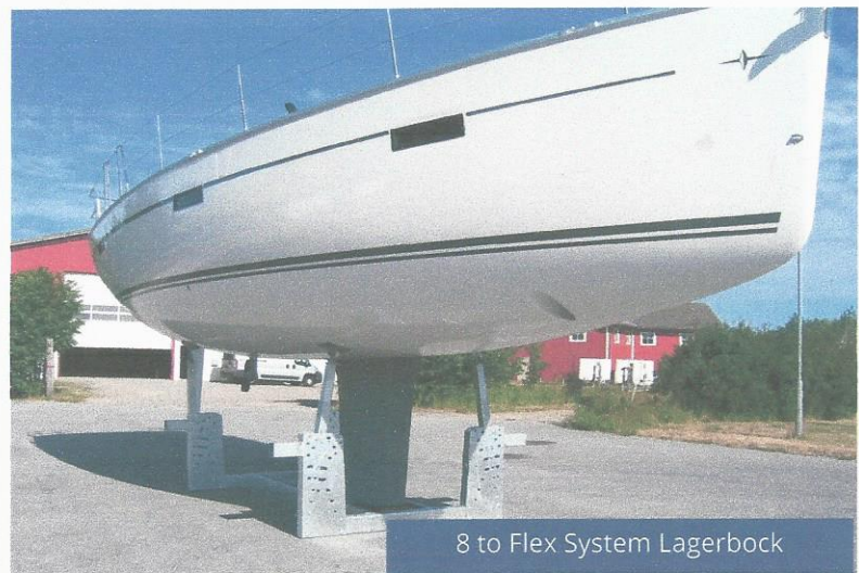
8 to Flex System Lagerbock